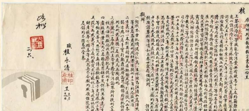
▲台灣省保安司令部原判處高澤照有期徒刑12年，參謀總長周至柔將判決呈請總統核示時，總統府參軍長桂永清建議改判死刑，蔣介石總統批示如擬。圖片出處：《湯守仁等案》，檔案管理局典藏國防部軍法局檔案。