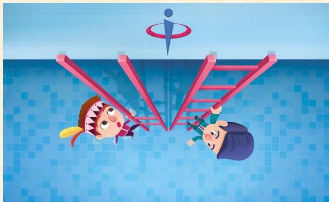
▲原住民僅能參選原住民選區立委(左)，無法參選一般區域立委(右)，造成制度上的

我國區域立委共 73 個選區，採單一選區制；原住民立委分平地、山地原住民 2 個選區，採複數選區制，各選 3 人，全國各地只要有原住民選舉人資格，都在原住民選區範圍。